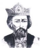
Б. Владимир Святославович (960 – 1015 гг.)