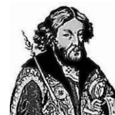
В. Владимир Мономах (1053 – 1125 гг.)