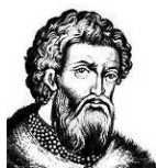
А. Александр Невский (1220 – 1263 гг.)