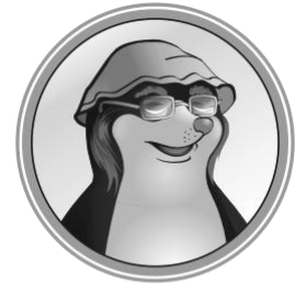
БИБЛИОТЕКАРЬ СУМЧАТЫЙ КРОТ